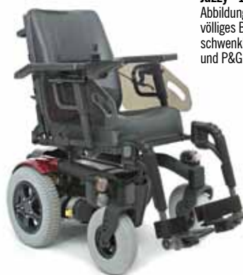
Jazzy® 1120 RWD EURO Abbildung mit Euro Kontursitz, völliges Beleuchtungspaket, schwenkbare beinstütze und P&G VR2 Steuerungstyp