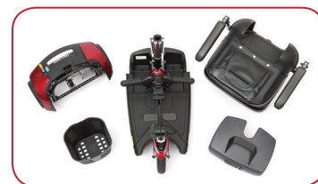
Demontage Met Slechts Één Hand

Het compacte design van de Go-Go Elite Traveller® stelt u in staat om eenvoudig te manoeuvreren in krappe ruimtes en tegelijkertijd stabiele buitenprestaties te leveren. Met een draagvermogen van 136 kg, een laadpoort in de stuurkolom, Vederlichte demontage en maximumsnelheden tot 7 km / h, Komt u eenvoudig waar u wilt gaan.