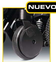
NUEVO - 8" ruedas traseras y delanteras