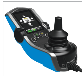
Mando evolutivo Q-Logic 2