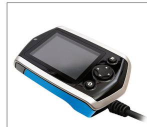
Control de entorno con infra-rojos y Bluetooth