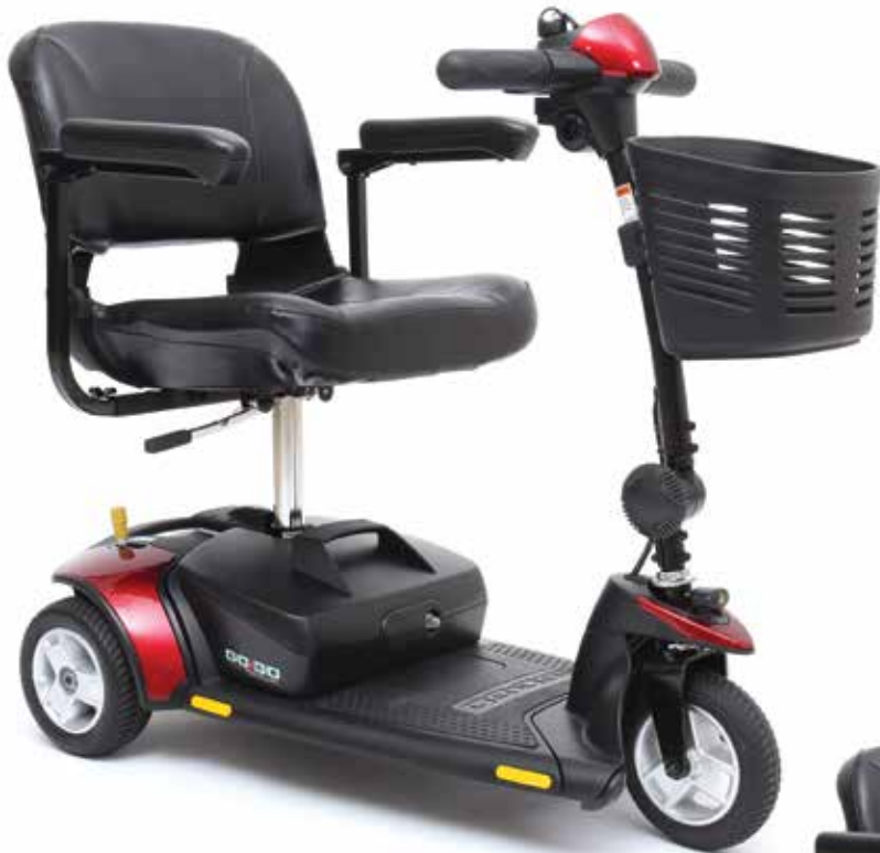
Go-Go Elite Traveller®, triporteur

Le Go-Go Elite Traveller® est facilement transportable et manoeuvrable dans des espaces restreints. Il vous offre une versatilité de style et de couleurs grâce à ses coquilles interchangeables en un rien de temps. Le design compact du Go-Go Elite Traveller vous donne accès aux corridors et autres endroits étroits, tout en vous assurant une grande stabilité à l'extérieur. Il est tellement facile à assembler et à désassembler que vous éliminerez une grande partie de l'insécurité liée à vos voyages. Allez sans tracas où vous le désirez avec le Go-Go Elite Traveller.