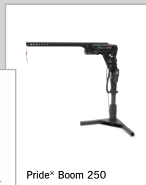
Pride® Boom 250

Beamsville, Ontario • 888-570-1113 • www.pridemobility.com