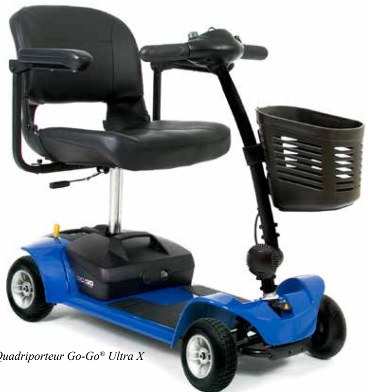
Quadriporteur Go-Go ® Ultra X