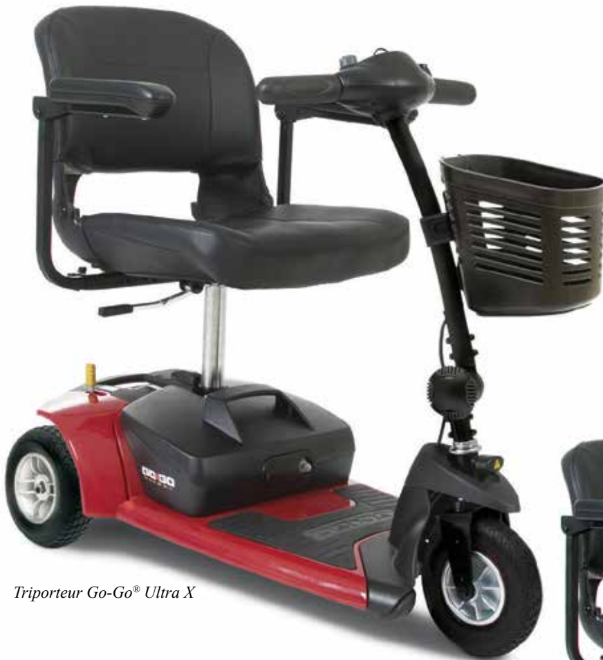
Triporteur Go-Go ® Ultra X

Le Go-Go ® Ultra X vous est offert avec une multitude de caractéristiques innovatrices, tel qu'un loquet de barrure automatique ultra simple, qui permet de le désassembler d'une seule main et un boîtier de batteries assurant un transport sans tracas. Vous retrouverez la performance que vous attendez du fabricant numéro 1 dans le domaine des scooters transportables et comprendrez pourquoi Go-Go ® Ultra X est une valeur sûr lorsque vous voyagez.