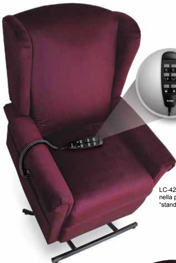
LC-425 mostrata nella posizione "stand"

La poltrona a due motori modello LC-425 vi donerà il massimo comfort, con uno stile di eleganza e design. Le posizioni ottenibili sono infinite e grazie alla seduta "Zero-Gravity" potrete godere di sollievo e supporto durante tutte le fasi del vostro riposo.