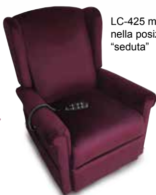
LC-425 mostrata nella posizione "seduta"