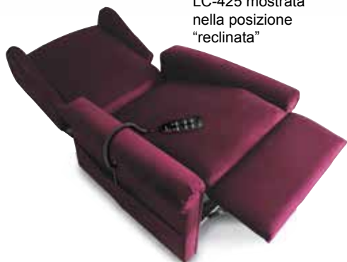
LC-425 mostrata nella posizione "reclinata"