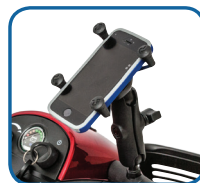
Soporte para teléfono celular