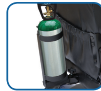
Soporte de tanque de oxígeno