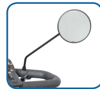
Espejo retrovisor adicional