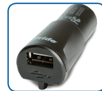
Cargador USB XLR