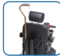
Soporte de muleta doble