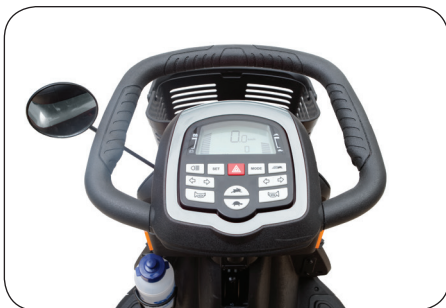
Tiller con consola LCD

El Pride® Zolar Scooter ofrece la maniobrabilidad de un scooter de 3 ruedas junto con características de alto rendimiento como suspensión completa y un sistema de frenos sellado hidráulico. El Zolar cuenta con un estilo elegante y agresivo y una gran cantidad de toques de lujo estándar, incluyendo un timón delta envolvente y la iluminación LED, lo que lo convierte en el último scooter al aire libre.